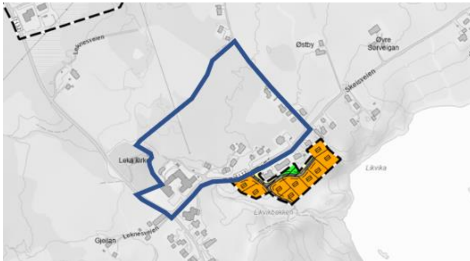
Oversiktskart som viser planområdet sin plassering (vist med blå avgrensning) og gjeldende plan mot sør, Husby Hyttegrend.