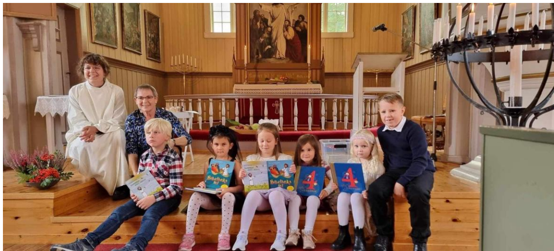
Bilde med de som kom og fikk bok. Storebror til høyre fulgte lillesøstra.