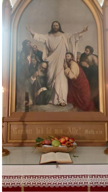
Alteret pyntet til Høst-takkefest

(det er også litt tekst under hvert bilde)