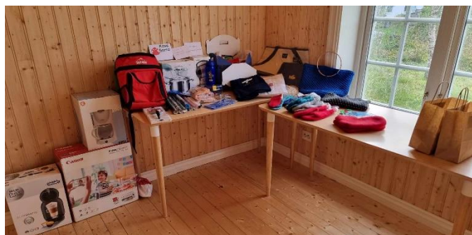
Fantastisk flott premiebord