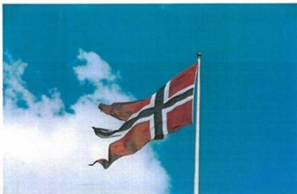
17. mai-komiteen 2024 - Solsem/Aune/Stein/Lekneskrysset