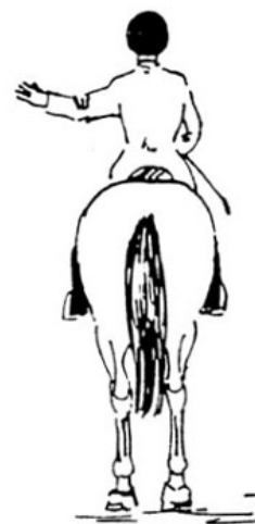
Jeg vil til venstre!

Tegningene er hentet fra heftet "Hest i Trafikken," som er utgitt av Landbruksforlaget i samarbeid med NRYF og Norsk Hestesenter.