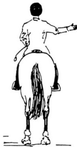
Jeg vil til høyre!