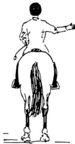
Jeg vil til høyre!