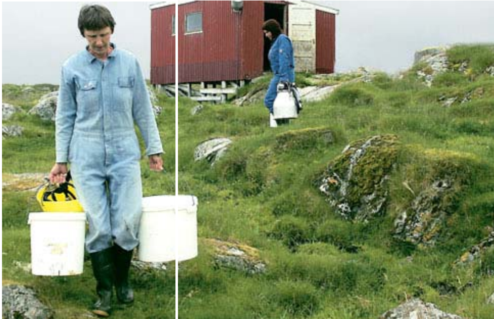
Bildet er fra en reportasje på øya for to år siden.