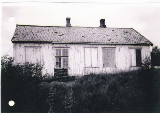
Gammelskolen før oppussing.