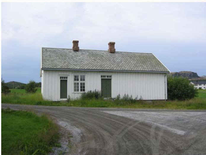
Gammelskolen i dag.