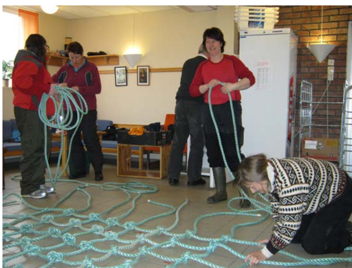
Knytning av nett til klatrestativ!