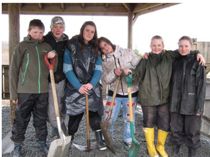
Nytt dekke i paviljongen!