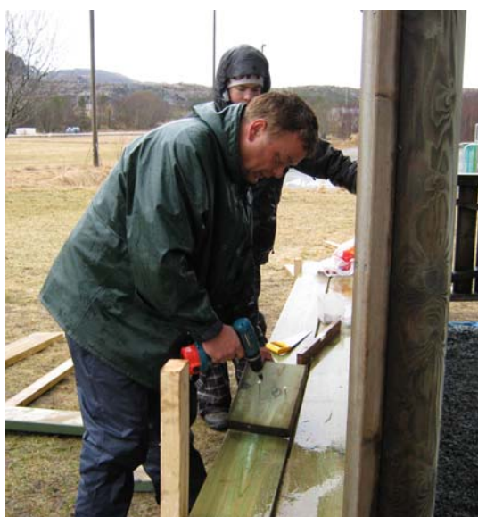
Ny benk ved paviljongen!