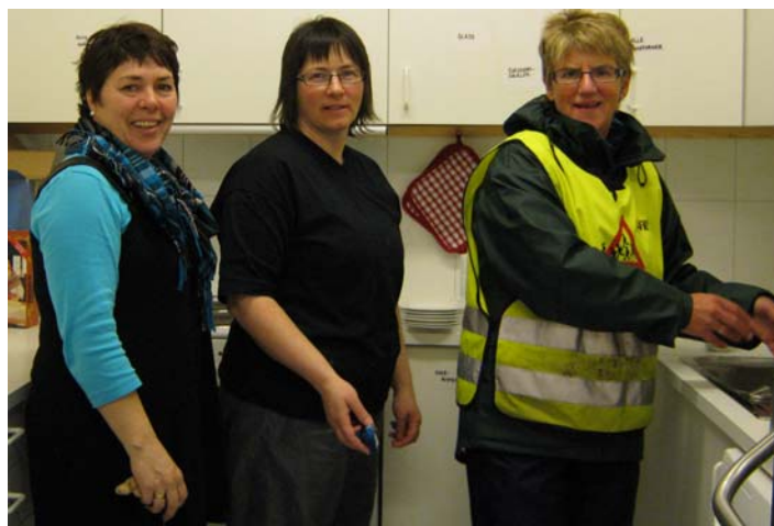
Etter mat venter oppvask!