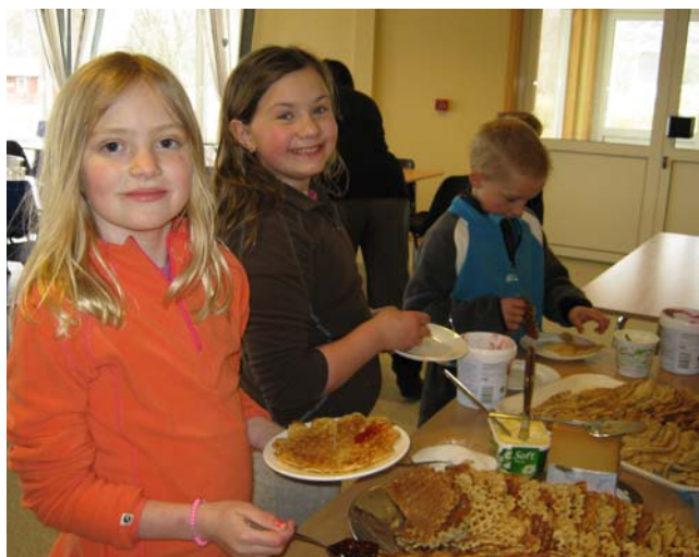
Mmmm, godt ja – og blide!

Mat må man ha - og vafler er KJEMPEGODT!