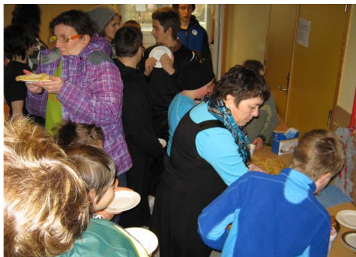
Til tider trengsel ved vaffelbordet!